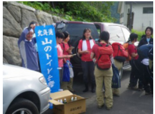
富良野岳登山口でのトイレデー