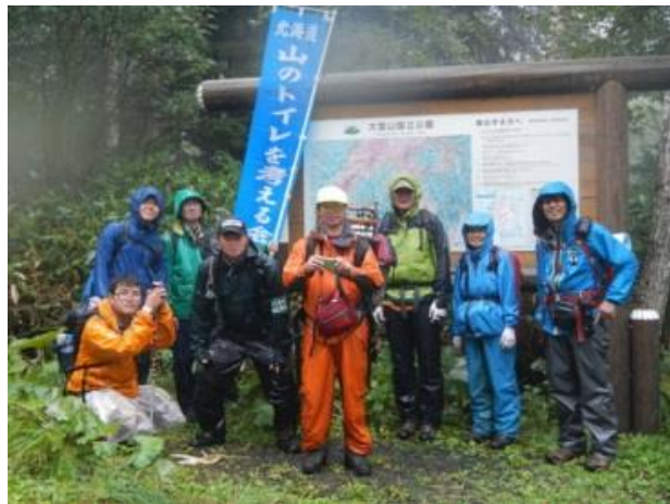
雨の中での美瑛富士トイレデー