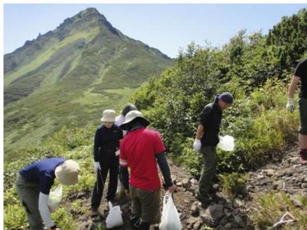
利尻山では毎年トイレデーを実施しています