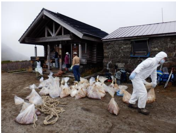
掻き出したオガクス(尿尿)を運搬する

バイオトイレの改良について検討していますが、コストや実施した後の保証の担保など課題が多く、関係者は頭を悩ましています。