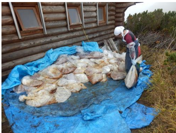
トイレ裏にストックされていたオガクス(尿尿)を運ぶ