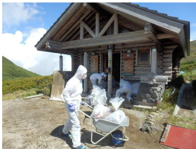
黒岳バイオトイレ・おがくず交換作業