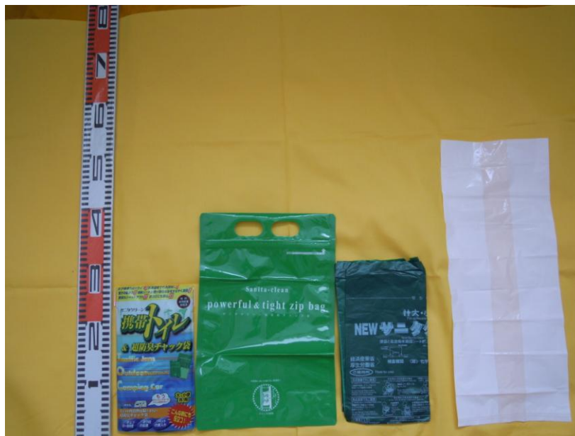
[例：サニタクリーンのセット+BOS（ボス）1袋]