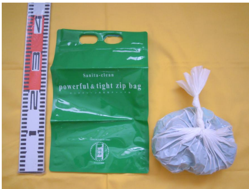
[便袋をボスに入れて2カ所結んだところ]