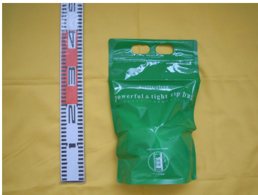
[ボスをチャック袋に入れます。回収BOXにはボスだけを入れます]