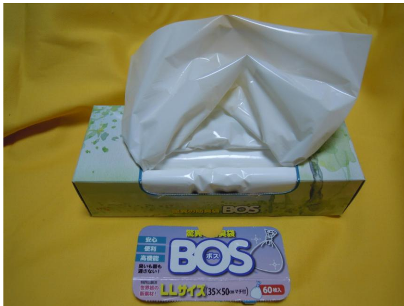
[BOS（ボス）LLサイズ1箱60枚入り1,490円アマゾンで購入]

臭いが気になって、携帯トイレを使用するのに抵抗がある方！防臭袋BOS（ボス）を使えば大丈夫です。北海道で購入しやすい「サニタクリーン」と「モンベル」の製品でテストしました。[BOS（LLサイズ 35cm×50cm マチ付）は医療用に開発された防臭袋で大人用オムツ（Lサイズパンツ）が4枚入ります。メーカー：クリロン化成（株）]