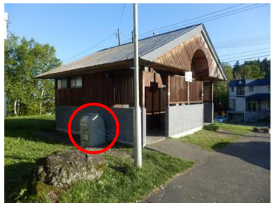
白金温泉公衆トイレ横の回収ボックス