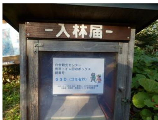
入林届のドアに掲示