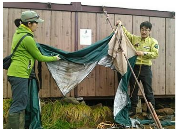
今年も強風によりブースが倒壊

環境省には利尻山や羅臼岳のような頑丈な固定式携帯トイレブースの一日でも早い設置を要請したいと思います。