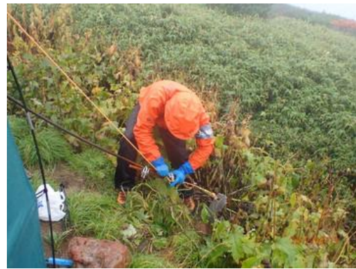
ブースの張り綱の調整