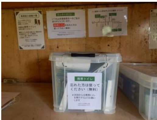
無料携帯トイレの小屋内配備

した。持ち出された携帯トイレは、実際に現地で使用されたか、家に持ち帰えられたか分かりませんが、ティッシュや汚物の減少に寄与したと考えています。