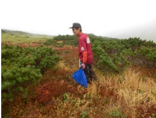
ティッシュと汚物の回収