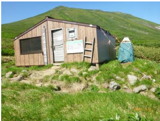
美瑛富士避難小屋の仮設携帯トイレブース