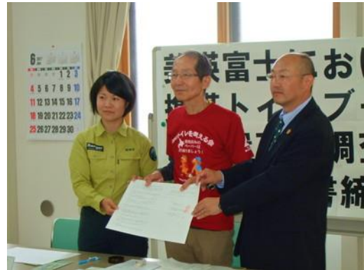
協定書の締結式（6月23日）

当日は、NHKのほか北海道新聞、朝日新聞から取材を受け、NHKニュースや新聞で報道されました。