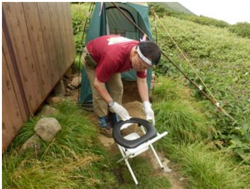
便座・便器の清掃