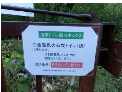
林道ゲート裏に掲示

回収ボックスは2015年、2016年は白金温泉公衆トイレの裏に設置したため、美瑛トイレ連絡会や登山者から「何処にあるのか分からない」との苦情がありました。2017年はトイレの横に設置、表から見えるようにしました。ここは観光客も多いことからゴミ投棄防止のためにダイヤル錠で施錠しています。この鍵番号「530」を登山者にいかに周知するかが課題です。回収ボックスにも白金観光センターで教えてくれることを掲示、避難小屋内や携帯トイレブース内でも案内しています。今年の下記写真のような対策も実施しました。