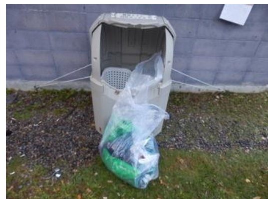
ブース撤収時は14個入っていた