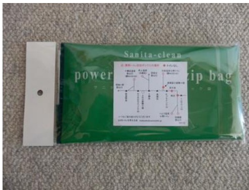
回収ボックスの場所を貼り付け