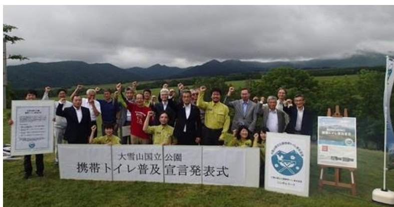
大雪森のガーデンでの宣言発表式典

この宣言に恥じないよう、今後も山のトイレマナーの啓発活動と携帯トイレの普及に取り組みます。