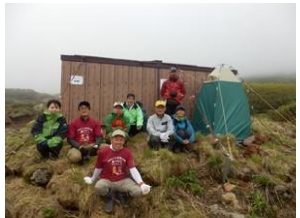
携帯トイレブースの設置を終えて

(※) 環境省、美瑛山岳会、山のトイレを考える会 回収ボックスの設置、使用済み携帯トイレの処分にご協力していただいた美瑛町と上富良野町の関係者の皆さまにもお礼申し上げます。