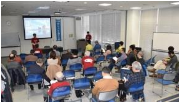
第19回フォーラムの様様

トムラウシ南沼での取り組みの認知度は89%、所持率は84%と高率でした(88パーティ・件)。議事要旨とフォーラム資料集はホームページに掲載されていますのでご覧ください。