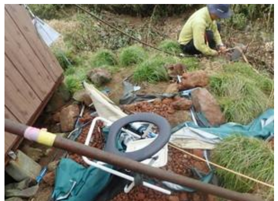
9月6日ブースが台風で倒壊、14日に再設置

考える会では昨年に引き続き、無料携帯トイレを避難小屋内に配備し、携帯トイレを所持していない登山者に