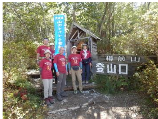
樽前山でのトイレデー

トイレデーは9月2日に実施しました。参加者は46名。北海道の15箇所の登山口で、トイレマップ307部、マナーガイド194部、マナー袋407袋、マナーカード418枚を配布しました。