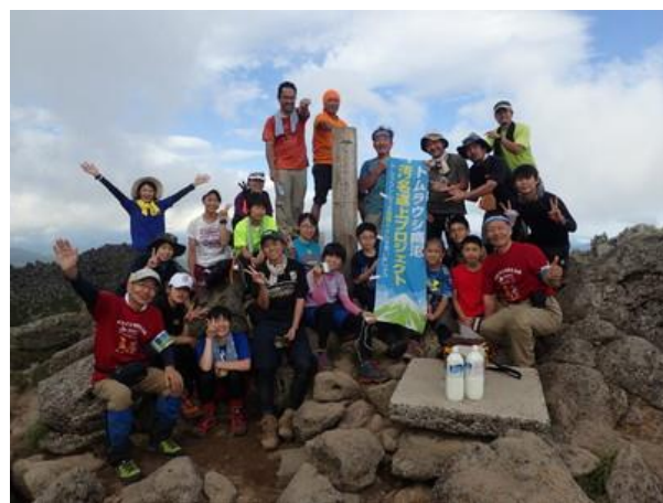
トムラウシグリーンクラブ(※)の皆さんと

考える会でのトムラウシ南沼でアンケート調査（7月28日～29日、では19枚回収、携帯トイレブースの使用動向調査も併せて行いました。