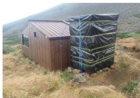
冬囲いされた携帯トイレブース