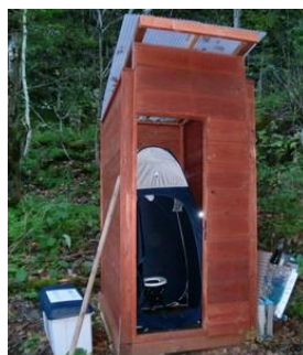
幌尻山荘・北電取水口の携帯トイレブースと回収ボックス