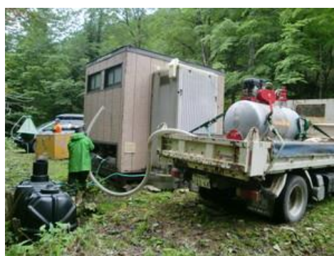
新冠ポロシリ山荘トイレの汲み取り作業