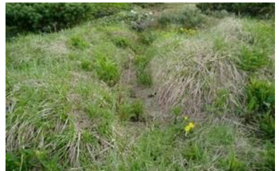
トイレ道の植生が回復してきた