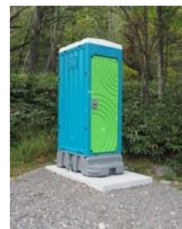
芽室岳登山口の仮設トイレ