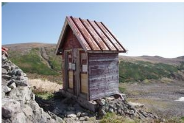
38年経過した白雲岳避難小屋トイレ

建設してから43年経った避難小屋は2020年に建替えられ新しくなりました。トイレは1985年（S60年）に設置、38年経過している水分浸透式の自然環境を汚染続けている汲み取りトイレです。