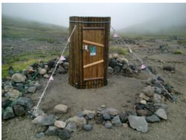
裏旭野営指定地に試行設置された携帯トイレブース

関連した事項では、2021年に当会や当会の趣旨に賛同した山岳7団体が現地でアンケート調査を実施、報告書を公表しました。1日でも早くブースが設置されることを願っています。