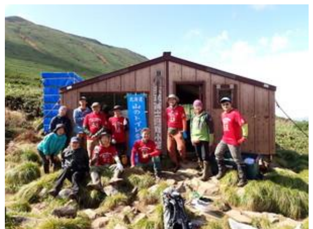
ブースの冬囲いと点検パトロール (10月1日)