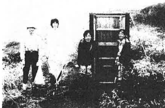
トムラウシ隊 (南沼トイレブースの前で)

昨年作成した山のトイレマップ「大雪・十勝編」と全道の「登山口トイレ情報」をバージョンアップしました。マップには、新たに「バイオトイレ情報」「携帯トイレブース情報」「携帯トイレ回収ボックス」等の情報を追加しました。これらは、山のトイレデー、各地の山開き、ビジターセンター、各種イベント等で配布しました。まだ、予備がありますので希望される方はお問い合わせください。