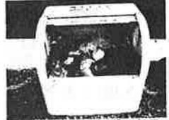
携帯トイレ回収ボックス