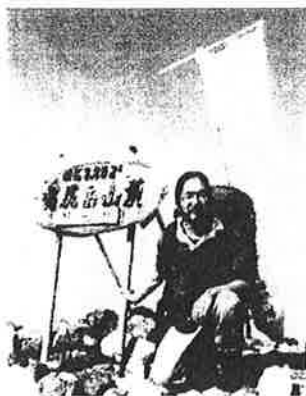
幌尻隊 (幌尻岳山頂)