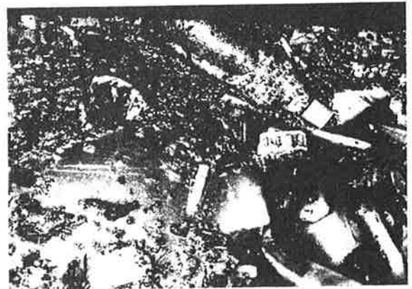
ヒサゴ沼トイレの便層の中。洗剤の容器、ビニール袋などびっしり

ヒサゴ沼避難小屋のトイレは、平成13年度、糞尿をヘリで搬出しました。見てください、まるでトイレがゴミ捨て場と化しています。残念! 洗剤の容器、ビニール袋、ティッシュの袋、生理用品などがびっしり。これらは一部の心無い人が捨てたものと思われませんが…。信じたくありませんが、これは事実です。でも弱音を吐くことはできません。私たち登山者は、一人一人が自分自身の問題として捉え、マナーを守って山に登りましょう。山にゴミは捨てないことは勿論、落ちていたら拾おう! もしトイレを誤って汚したら自分で拭いて綺麗にしよう! トイレが汚れていたら清掃しよう! 北海道の山をいつまでも綺麗にしよう!