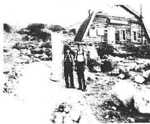
十勝隊 (十勝岳避難小屋前)