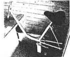
沼ノ原登山口バイオトイレの自転車こぎ