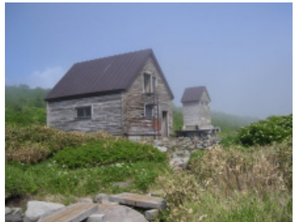
ヒサゴ沼避難小屋とトイレ(557年建設)