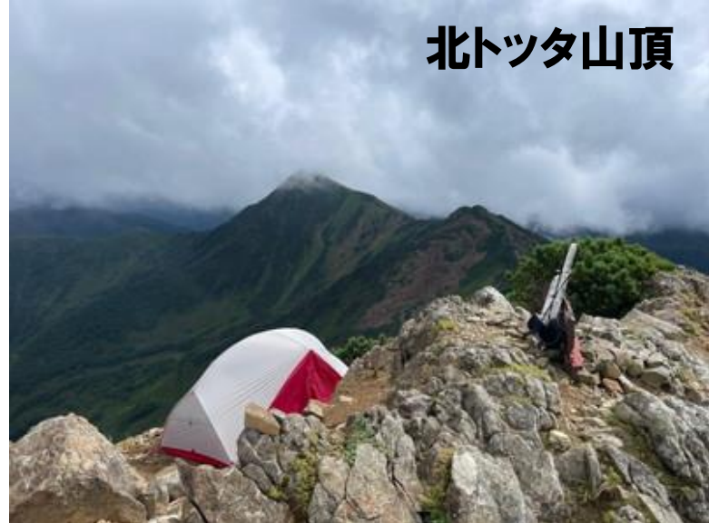
yamap・sumagariさんの写真借用