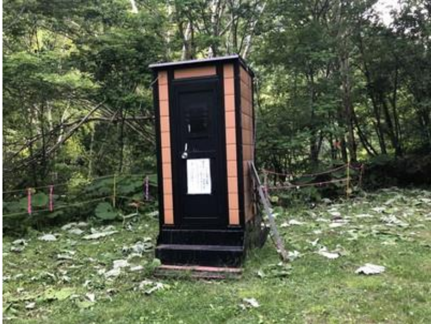
北戸蔦別岳登山口(二岐沢)トイレ