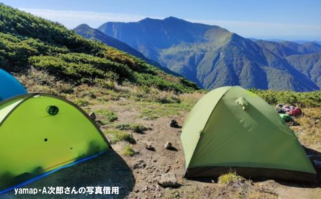
yamap・A次郎さんの写真借用