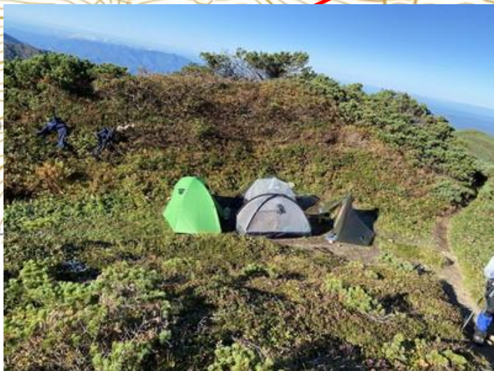
yamap・ジュンチンさんの写真借用