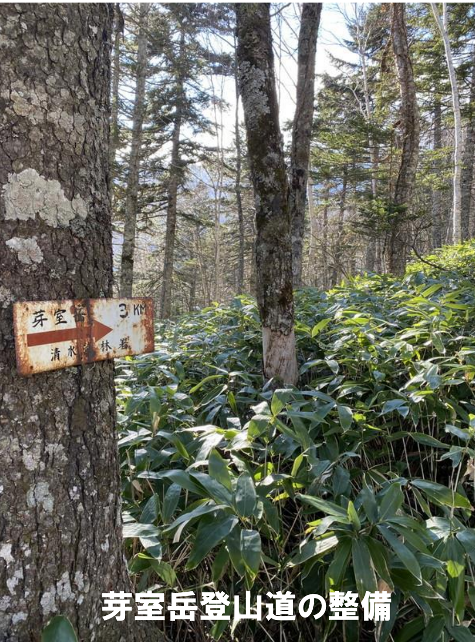
芽室岳登山道の整備