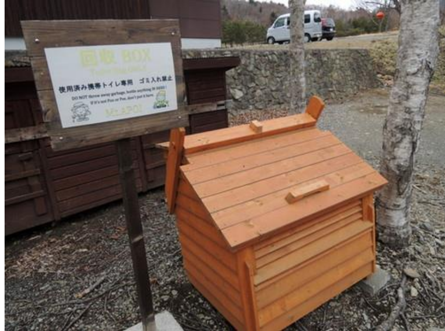
アポイ岳登山口の携帯トイレ回収ボックス