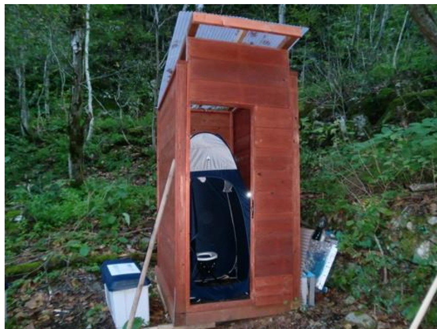
幌尻岳・北電取水口の携帯トイレブース