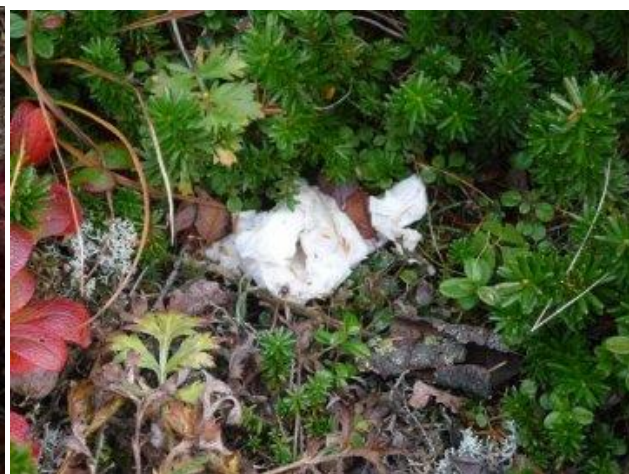
北トツタ山頂から北東へ20m地点(2009年)