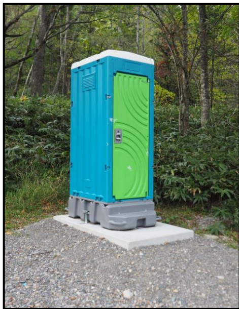
芽室岳登山口トイレ