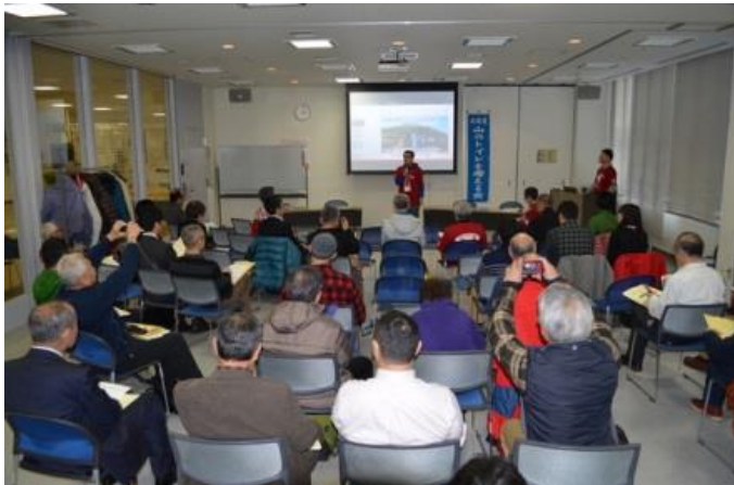
参加者52名。熱心な意見交換が行われました