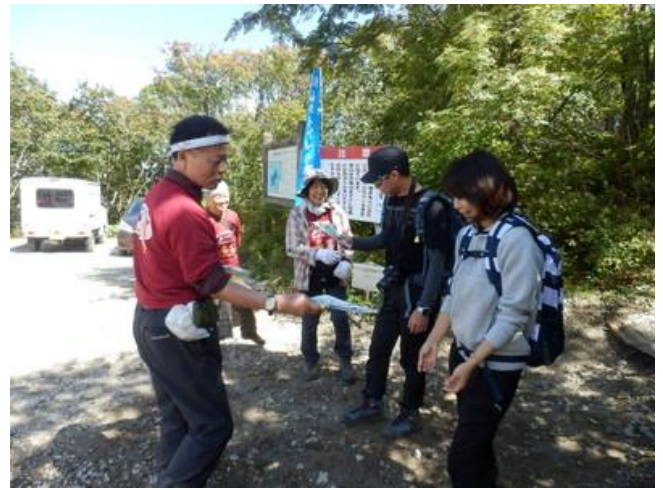
樽前山でのトイレデー

特にティッシュ持ち帰りを呼びかけました。皆さま好意的にリーフレットを受け取ってくれました。