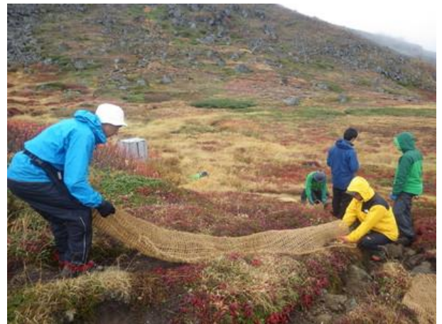
トイレ道の植生回復のためヤシネットを敷設