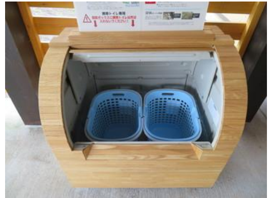
旭岳ビジターセンターの回収ボックス

使用済み携帯トイレの回収を担っている町役場の廃棄物収集者が直接手に触れることなく回収でき、不快な思いを軽減し衛生的になったと思います。