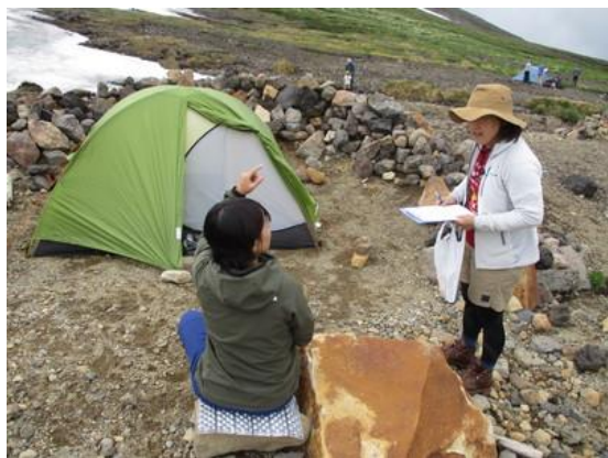
登山者へ対面での聞き取り調査