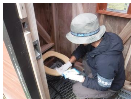
便座の清掃（北海道山岳ガイド協会）

回収ボックスの設置、使用済み携帯トイレの処分は美瑛町で担当していただいています。