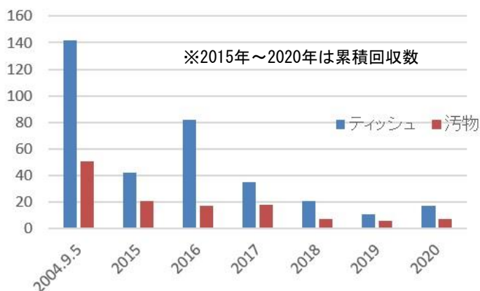
美瑛富士のティッシュと汚物回収数の年度推移

携帯トイレブースの設置、回収ボックスの設置、各山岳団体による広報、さらに新聞などのマスメディア、ホームページやSNSを活用した広報等いろいろな施策が結果として表れたと思います。