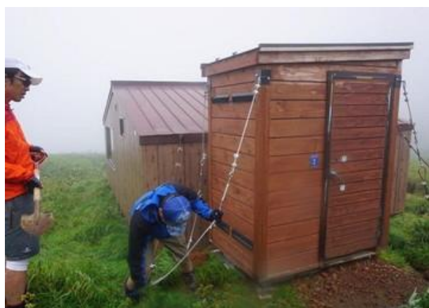
支線ワイヤー緩み・仮補強（山のトイレを考える会）