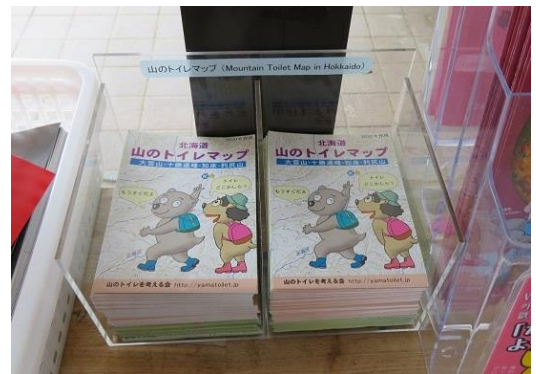
十勝岳温泉凌雲閣様では玄関に配備

宿泊施設、ビジターセンター、森林管理署などの協力をいただき、大雪山国立公園の13カ所で7,500部、知床、利尻山等で2,000部、全部で9,500部配布できました。