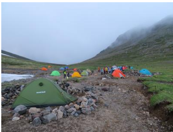
7月18日、テント数は28張ありました

大雪山国立公園携帯トイレ普及宣言が2018年に発表されました。登山者が安心して携帯トイレを使える野営地となるよう、携帯トイレブースの設置に向け取り組むこととします。