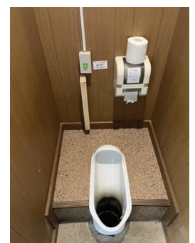
ペテカリ山荘のトイレ