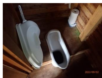
札内川ヒュッテのトイレ

日高山脈は大雪山国立公園と異なり、稜線には山小屋やトイレは一切ありません。携帯トイレの普及についても大雪山国立公園でのノウハウを活かし、検討していきたいと考えています。