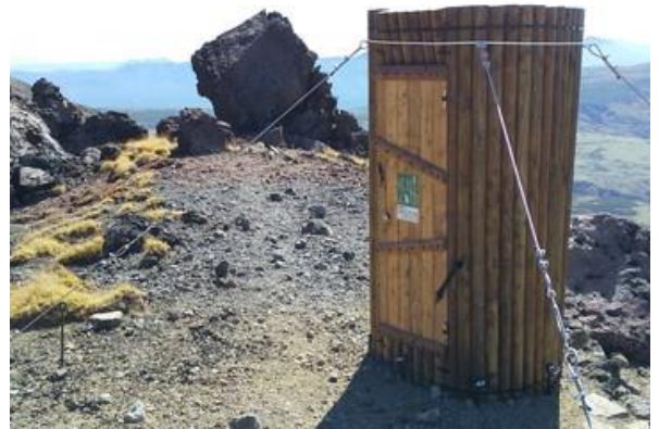
旭岳9合目の携帯トイレブース

9月には旭岳9合目のニセ金庫岩付近に環境省で木製の携帯トイレブースを試験設置しました。ここは強風の通り道で、いかに風に耐えることができるかが試されます。耐風構造で工夫がされていますが、さらに改良を加え、来年の夏期シーズンに備えるとのことでした。