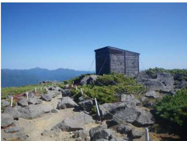
赤岳コマクサ平に設置された携帯トイレブース

8月、赤岳のコマクサ平にNPO法人かむいが木製の携帯トイレブースを設置しました。設置許可申請から始まり、製作、設置を当法人が実施しました。また今後の維持管理についても当法人が担うとのことです。