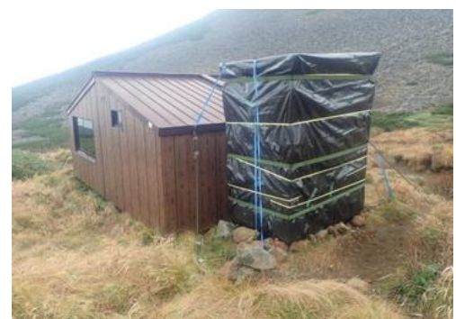
冬囲いされた携帯トイレブース