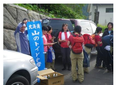
山のトイレデー（左は十勝岳2015年、右は十勝岳温泉2009年）