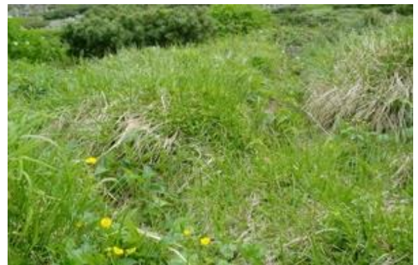
トイレ道の植生が回復してきました