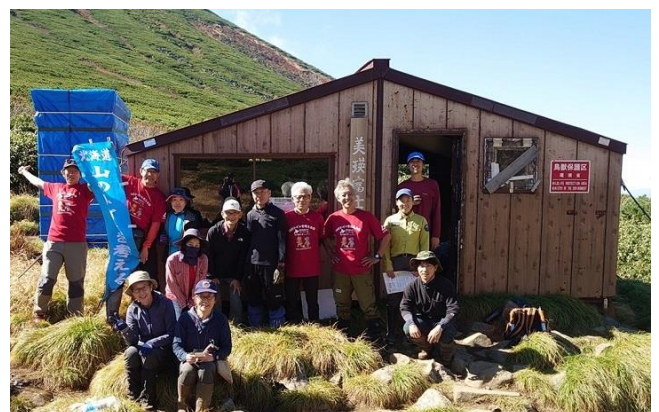
ブースの冬囲いと点検パトロールが終わって（9月29日）

縦横無尽にあったトイレ道の植生が回復し、判別できないほど薄くなりました。ブースの利用数は365でした。