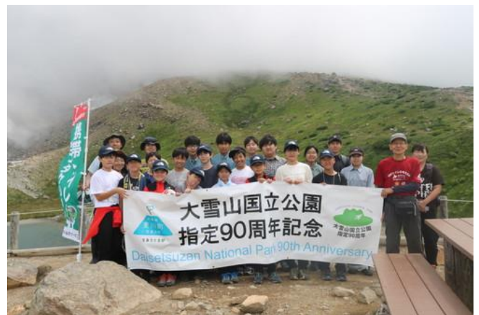
大雪山十勝岳愛護少年団と写す（旭岳5合目）

生徒は東川中10人、美瑛町の美沢小8人のほか先生や保護者。姿見駅のデッキで携帯トイレの使い方を説明、5合目ではA3ラミネートを使って、携帯トイレ普及に至る背景と山岳トイレの現状について説明しました。その後、生徒が登山者に携帯トイレを配布し、利用を呼びかけました。外国人に英語で話す生徒もいて楽しく有意義なイベントだったと思います。