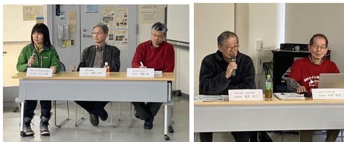
左から山北氏、齊藤氏、高橋氏、藤木氏のパネラーと仲俣