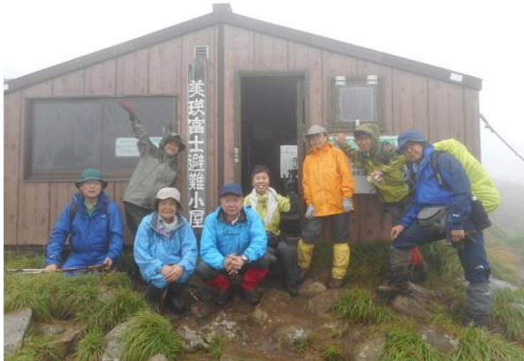
道央地区勤労者山岳連盟