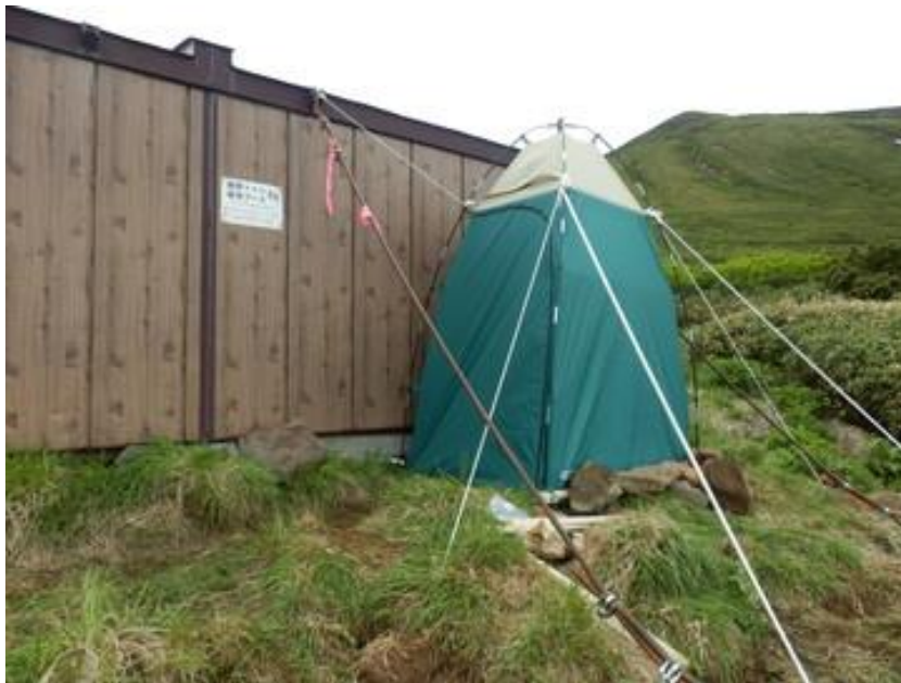
テント型携帯トイレブース (2015年～2019年)