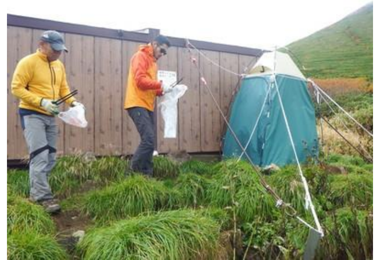
北海道山岳ガイド協会