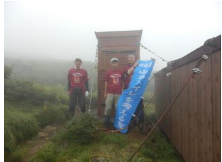
山のトイレを考える会