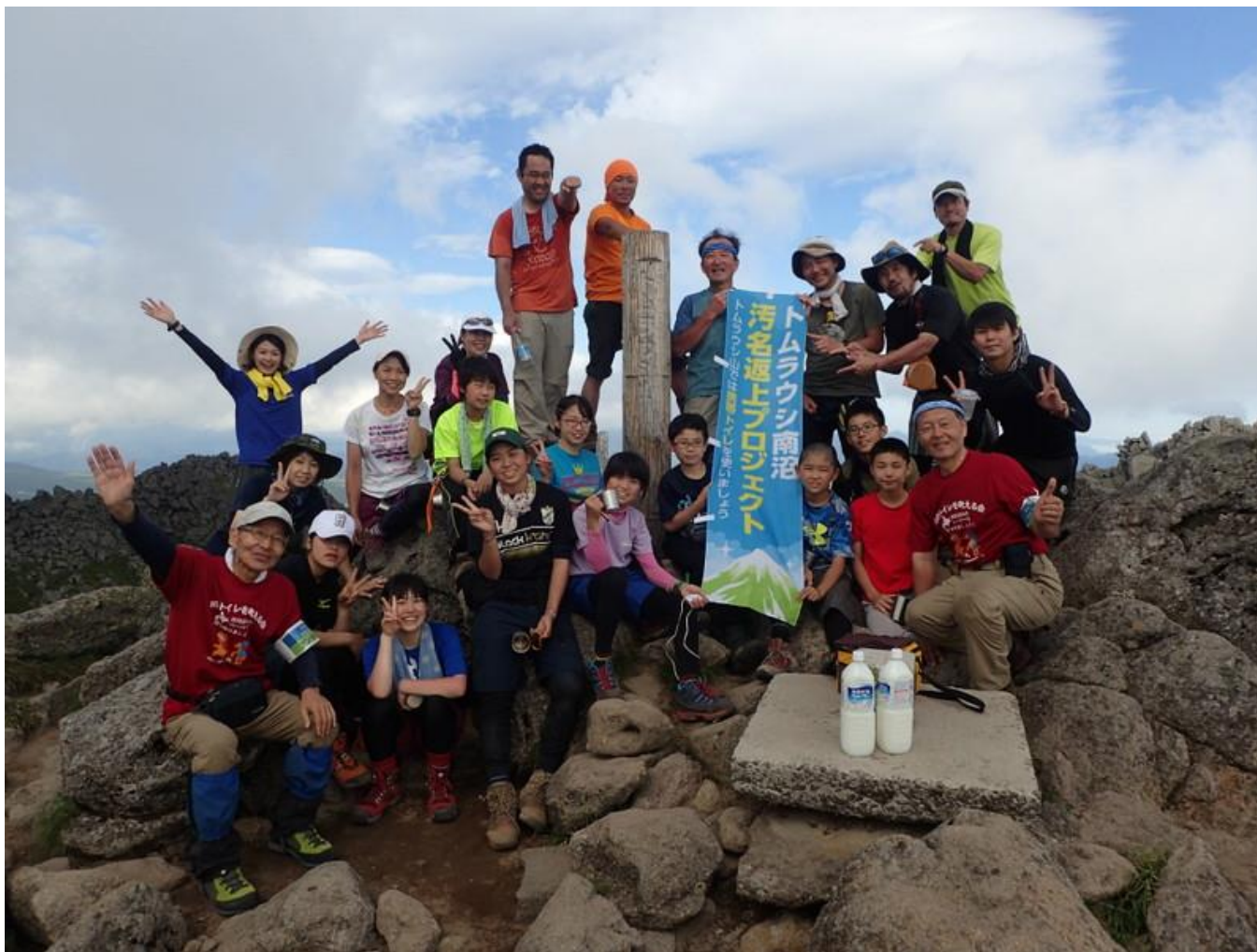
トムラ山頂でのトムラウシ少年グリーンクラブの皆さんと(2018)