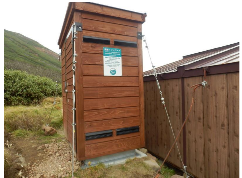
常設型携帯トイレブース (2019年9月完成)