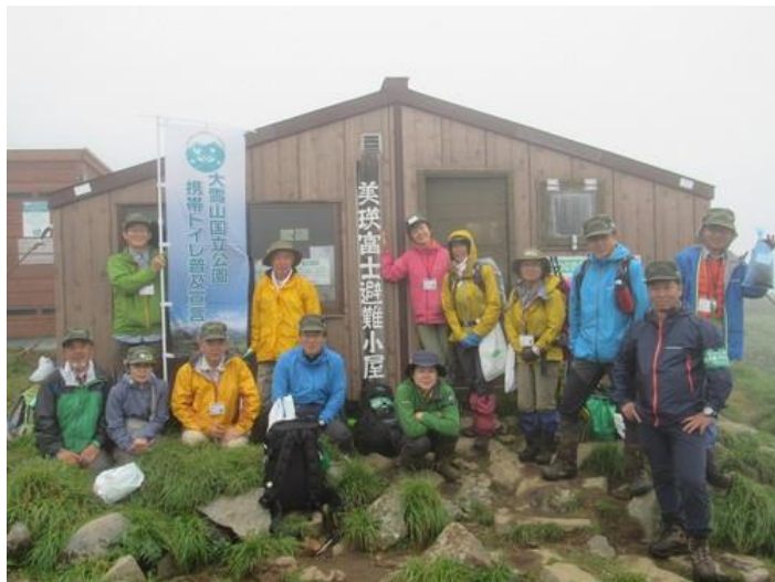
大雪山国立公園パークボランティア連絡会