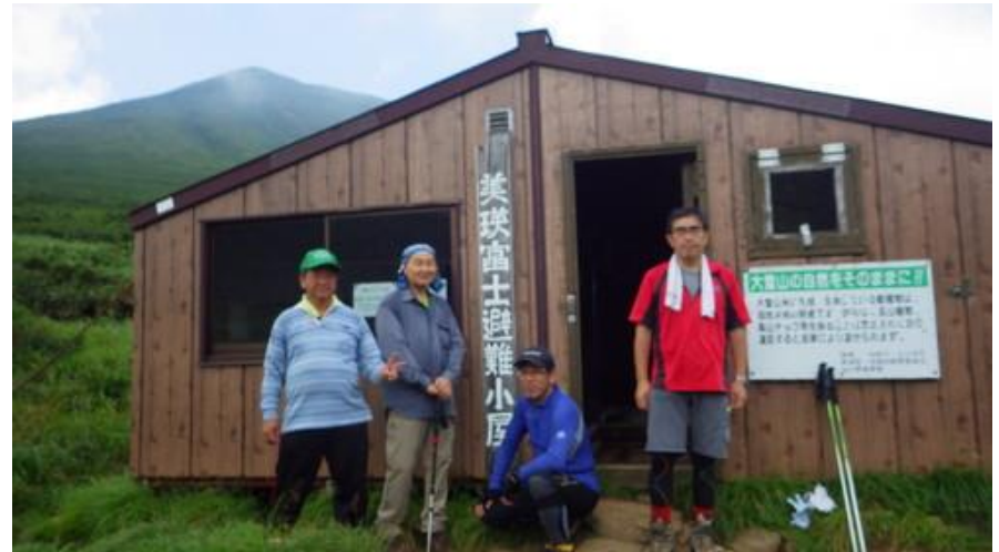
道北地区勤労者山岳連盟