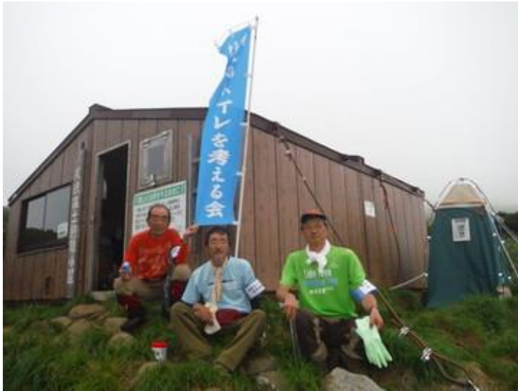
日本山岳会北海道支部