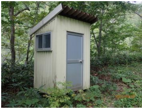
トイレには窓がある