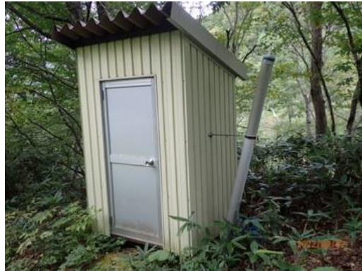
換気筒も付いていた