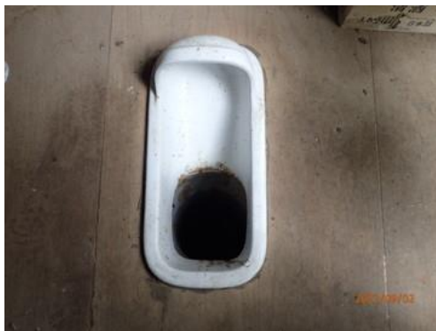
便器も汚れていなかった