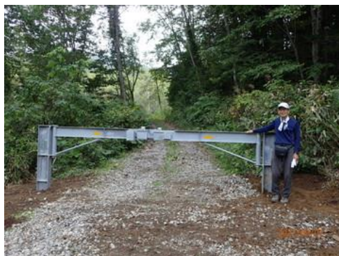
オピリネップ林道入口に新しくゲートが設置された（通常は開放。林道崩壊時に閉鎖）