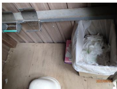
箱が置いてありトイレ紙が入っていた