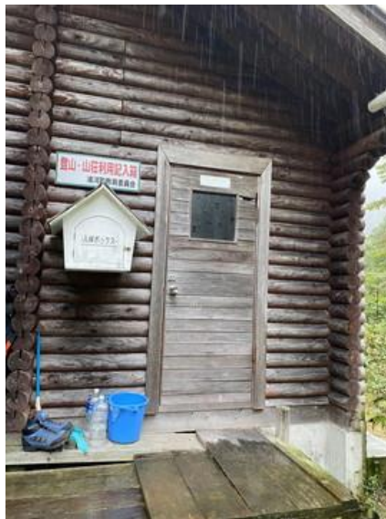
トイレは一旦小屋外に出てから入る 登山・山荘利用記入箱もある