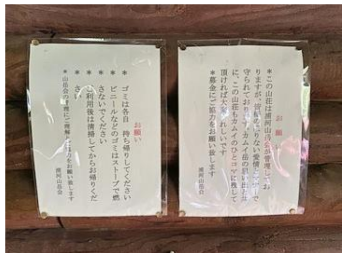
浦河山岳会からのお願い

(トイレについて) ・トイレットペーパーの芯が2本、その切れ端、ビニール袋、レジ袋が床の隅に落ちていたり、バケツ内に無造作に入れられていた。・便器には大便が少量でしたが付着したままでした。便槽内が満杯に溜まっていたため、水を掛けてのブラッシングは控えました ・トイレ内にブラシ2本、洗浄剤、便器洗浄用に転用したと思われるペットボトル2本、消臭剤が置いてありました (その他) ・窓は4箇所ありますが、網戸は未設置です ・小屋内外に忘れ物やいろいろな放置物がありました