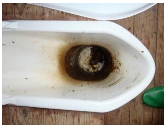
トイレはし尿で満杯のようだった